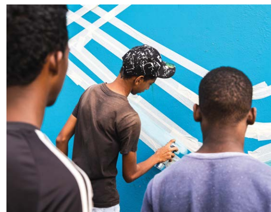
Atelier graff lors de l'inauguration du jardin Alphonsine Bélon

PRUNEL est un projet de renouvellement urbain qui entend laisser une large place à la créativité, à l'imaginaire et l'évasion. Au pied des immeubles, au coin des rues ou sur les façades des grands ensembles, les artistes participent à PRUNEL en y ajoutant leur interprétation du quartier ou en laissant libre court à leurs envies. C'est la création et l'art qui se mettent au service de la qualité de vie des habitants pour offrir un environnement renouvelé !