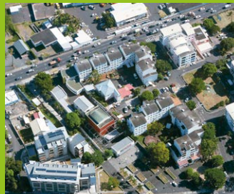
Photo aérienne de l'ensemble Piranhas Casse Pierre qui fera en partie l'objet d'une déconstruction.

C'est ensuite le quartier Vauban qui sera concerné avec la déconstruction de Vauban 1 en deux phases. Un nouveau projet verra le jour dans les prochaines années permettant de redynamiser tout le secteur avec des commerces, l'accueil d'entreprises, une résidence pour personnes âgées et des logements plus sécurisés et plus sobres en énergie. C'est une grande partie de la ville qui bénéficie de ces avancées avec la création de nouveaux axes piétons et vélos et des espaces de respiration et de jeux pour les habitants.