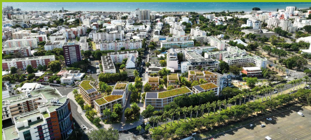
Perspective aérienne du projet en réflexion sur le quartier Vauban.